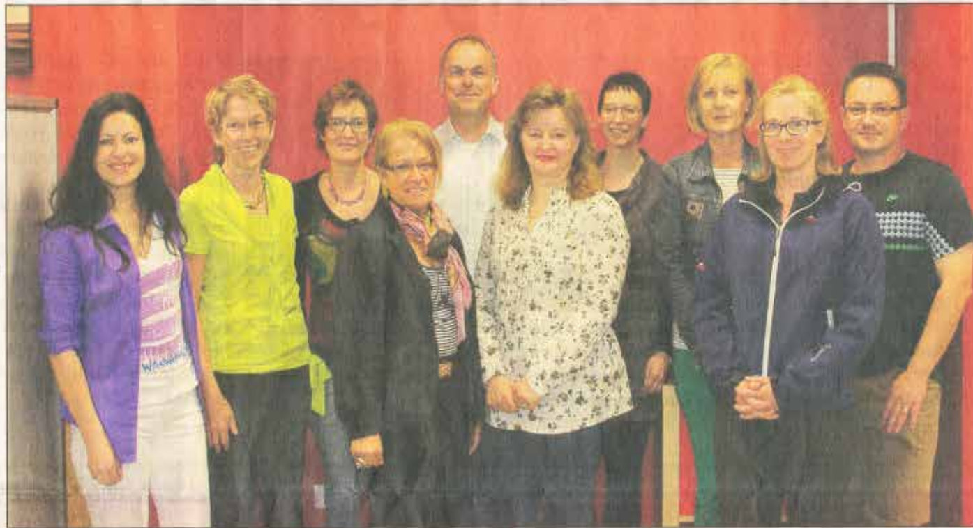
Der neue Vorstand des Fördervereins der Dreieichschule hat sich gefunden.