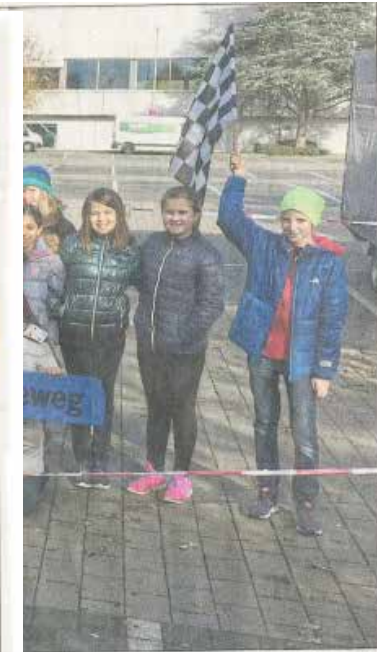
ehrraining des ADAC den Fünftklässlern eirat organisiert hatte.

reitsitz des ADACs teil- nehmen durften. Dort lern- ten sie, welche Wirkung ein Sicherheitsgurt im Falle einer Vollbremsung hat – und er- fahren hautnah, wie wichtig das korrekte Anschnallen ist. An der Dreieichschule hat das Training „Aktion Auto“ als Beitrag zur schulischen