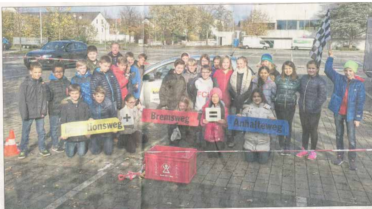
Reaktionsweg plus Bremsweg gleich Anhalteweg – diese Gleichung brachte das Intensiv-Verkehrstraining des ADAC den Fünftklässlern auf dem Parkplatz der Stadthalle näher. 28 Schüler nahmen an der Aktion teil, die der Elternbeirat organisiert hatte.

Person unbedacht über die Straße läuft. Das war eine eindrückliche Erfahrung für die Schüler. „Lieber ein Auto vorbeifahren lassen und warten. Noch vor dem Auto über die Straße zu rennen, kann lebensgefährlich sein“, resümierten einige von ihnen. Actionreich wurde es, als