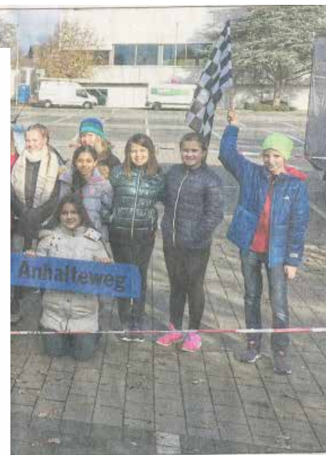
Intensiv-Verkehrstraining des ADAC der Fünftklässler der Dreieichschule, die von der Elternbeirat organisiert wurde.

ersitz des ADAC-Autos Platz nehmen durften. Dort lernten sie, welche Wirkung ein Sicherheitsgurt im Falle einer Vollbremsung hat – und erfahren hautnah, wie wichtig das korrekte Ansnallen ist. An der Dreieichschule hat das Training „Aktion Auto“ als Beitrag zur schulischen