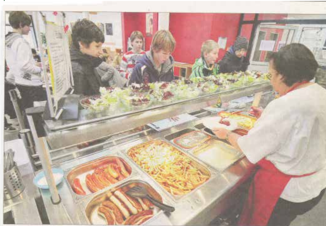
Seit einem knappen halben Jahr serviert das Mensateam in Regie des Fördervereins täglich Essen für die Dreieichschüler. Ein Problem ist der Platzmangel, die 100 Plätze sind meist schnell belegt. Besser wird's, wenn im Sommer die Terrasse genutzt werden kann – vorausgesetzt, der Förderverein findet noch weitere Sponsoren für wetterfeste Tische und Bänke.

Seit einigen Monaten können die Schüler der DSL hier Mittagessen Beurteilung: PRIMA!