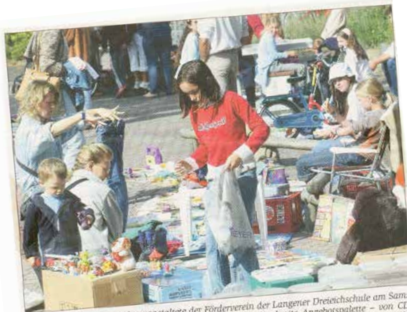
ZUM ALLERERSTEN MAL veranstaltete der Förderverein der Langener Dreieichschule am Samstag einen Flohmarkt. Auf dem Schulhof gab es dabei eine breite Angebotspalette – von CDs über Spielzeug und Lernmaterialien bis hin zu Büchern. Die Besucher nutzten das schöne Wetter, um ausgiebig zu stöbern, zu feilschen und zu kaufen. Für die Verkäufer hatte sich der Förderverein ein besonderes Schmankerl ausgedacht: Im Gegensatz zu vielen anderen Flohmärkten wurde am Dreieich-Gymnasium keine Standgebühr fällig.