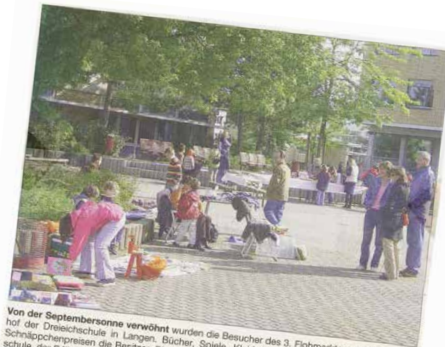
Von der Septembersonne verwöhnt wurden die Besucher des 3. Flohmarktes auf dem Schulhof der Dreieichschule in Langen. Bücher, Spiele, Kleidung und vieles mehr wechselten zu Schnäppchenpreisen die Besitzer. Für das leibliche Wohl sorgte der Förderverein der Dreieichschule, der Erlös aus Getränke- und Kuchenverkauf fließt in Projekte an der Schule.