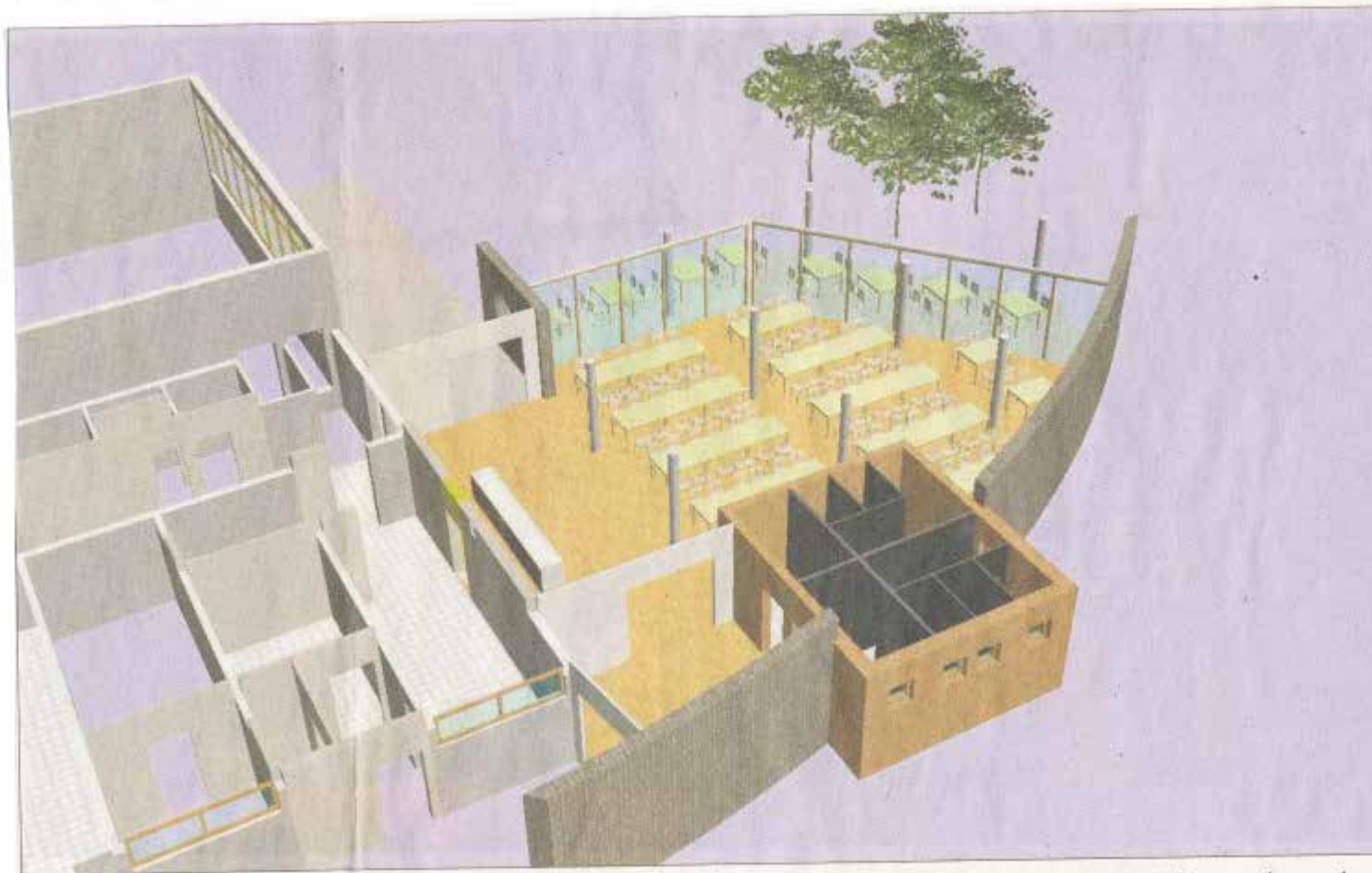
Wohlfühlarchitektur statt Kantinen-Tristesse: Auf dem Papier gibt's den Speisesaal-Anbau samt neuer Toilettenanlage schon. Jenseits der großzügigen Glasfront zum alten SSG-Sportplatz hin wird als Clou des Campus' eine Terrasse entstehen.