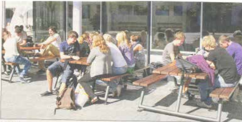
Freiluftgenuss für Schüler der Dreieichschule: Vor einem Jahr fiel der Startschuss für die Mensa am Gymnasium, und längst ist die fester Bestandteil im Schulalltag. Und auch im überdachten Außenbereich der Mensa kann gespeist werden – neue Tische und Bänke wurden aufgestellt. Möglich wurde dies durch Spenden von Eltern, der Schülervertretung und der Betreuung. Einige Tische müssen noch gekauft werden. Spenden sind weiterhin gern gesehen.

Bei Bremsübungen lernten die Kinder, dass der Anhalteweg eines Fahrzeugs das Ergebnis von Reaktionszeit und Bremsweg ist, und wie sie das eigene Verhalten entsprechend anpassen können. Praktisch verdeutlichte das ADAC-Mobil den Kindern: Schon bei 30 Stundenkilometern kann das Anhalten eines