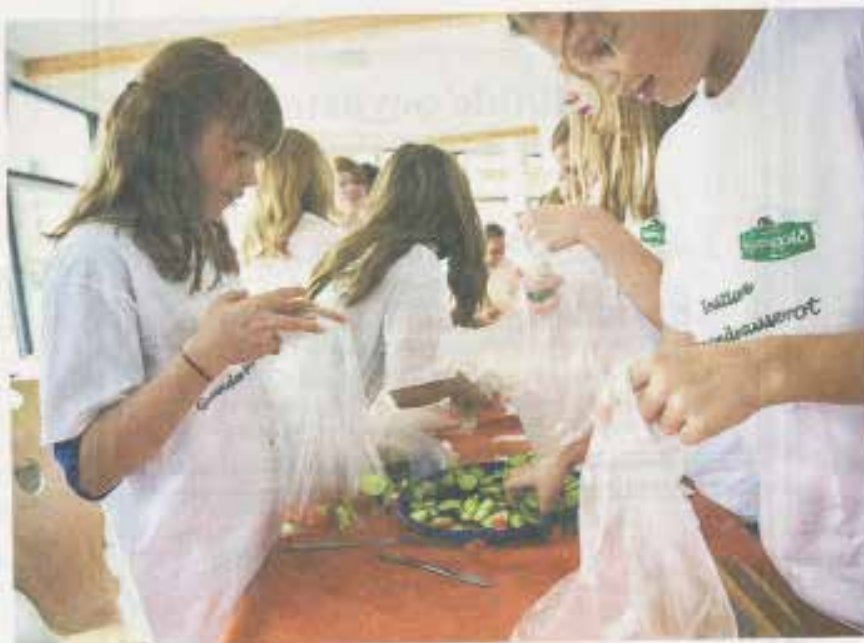
Mundgerecht: Langener Schülerinnen füllen Beutel mit Gemüsescheiben.

Vanessa, Verena und ihre Kameraden aus der Klasse 6e der Dreieichschule in Langen schneiden Salatgurken und Karotten in dünne Scheiben, füllen Gemüsemischungen in Plastikbeutel und belegen Brot mit Wurst, Käse, Salat und Tomaten. Auch eine siebte Klasse hilft mit. Brote und Gemüsesnacks werden in den Pausen verkauft. Die Dreieichschule hat sich am Montag an Deutschlands größter Pausenbrot-Initiative beteiligt: Mehr als 30 000 Kindergartenkinder und Schüler sollen in den nächsten Monaten erfah-